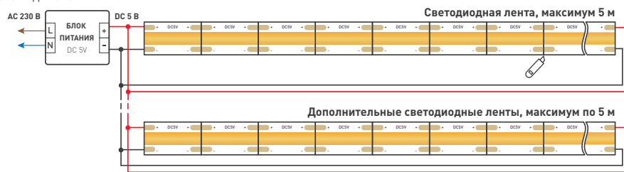
Схема 1. Подключение нескольких светодиодных лент с двух сторон